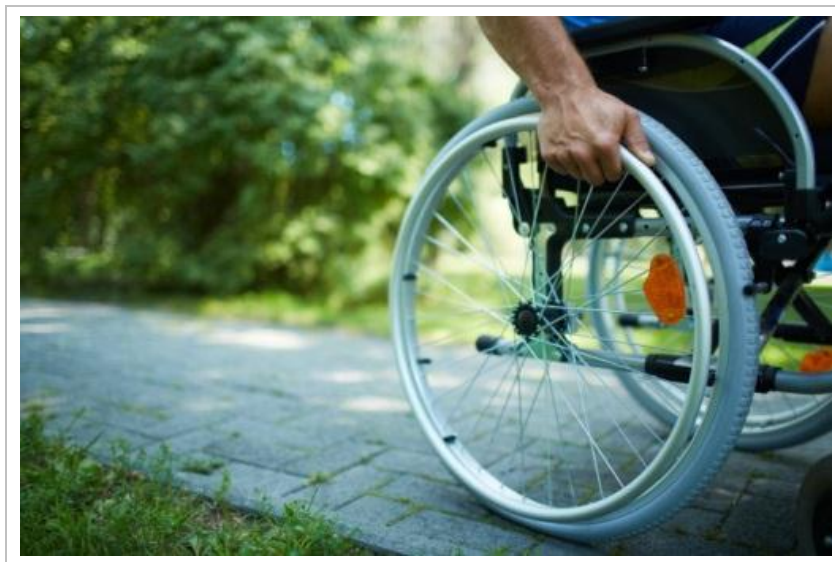
Rysunek 3.2 Osoba niezdolna do pracy fizycznej